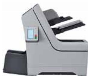
2 Dokumentenzuführungen + Beilagenzuführung